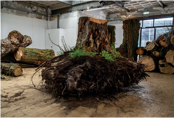
Through Bone and Marrow, Frank Bruggeman