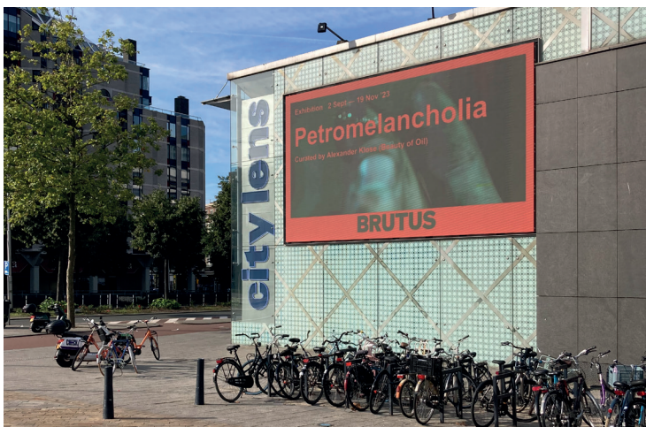
Petromelancholia, Coolsingel Rotterdam