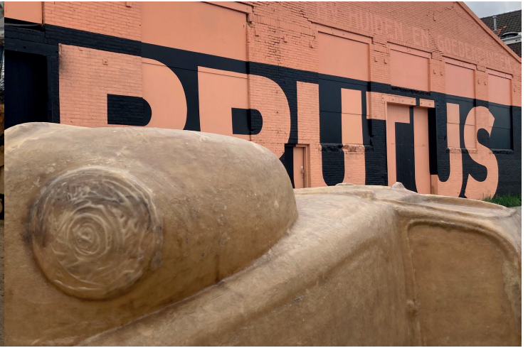
Olaf Mooij solo exhibition