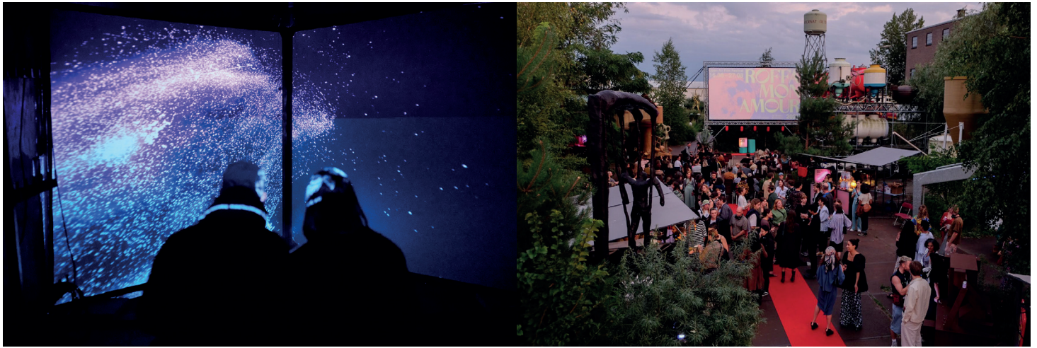
Rotterdam Art Week, 2023