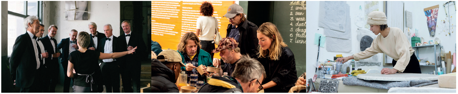
Rondleidingen en workshops at Brutus