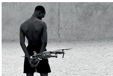
Santiago Sierra; Pilot 2023