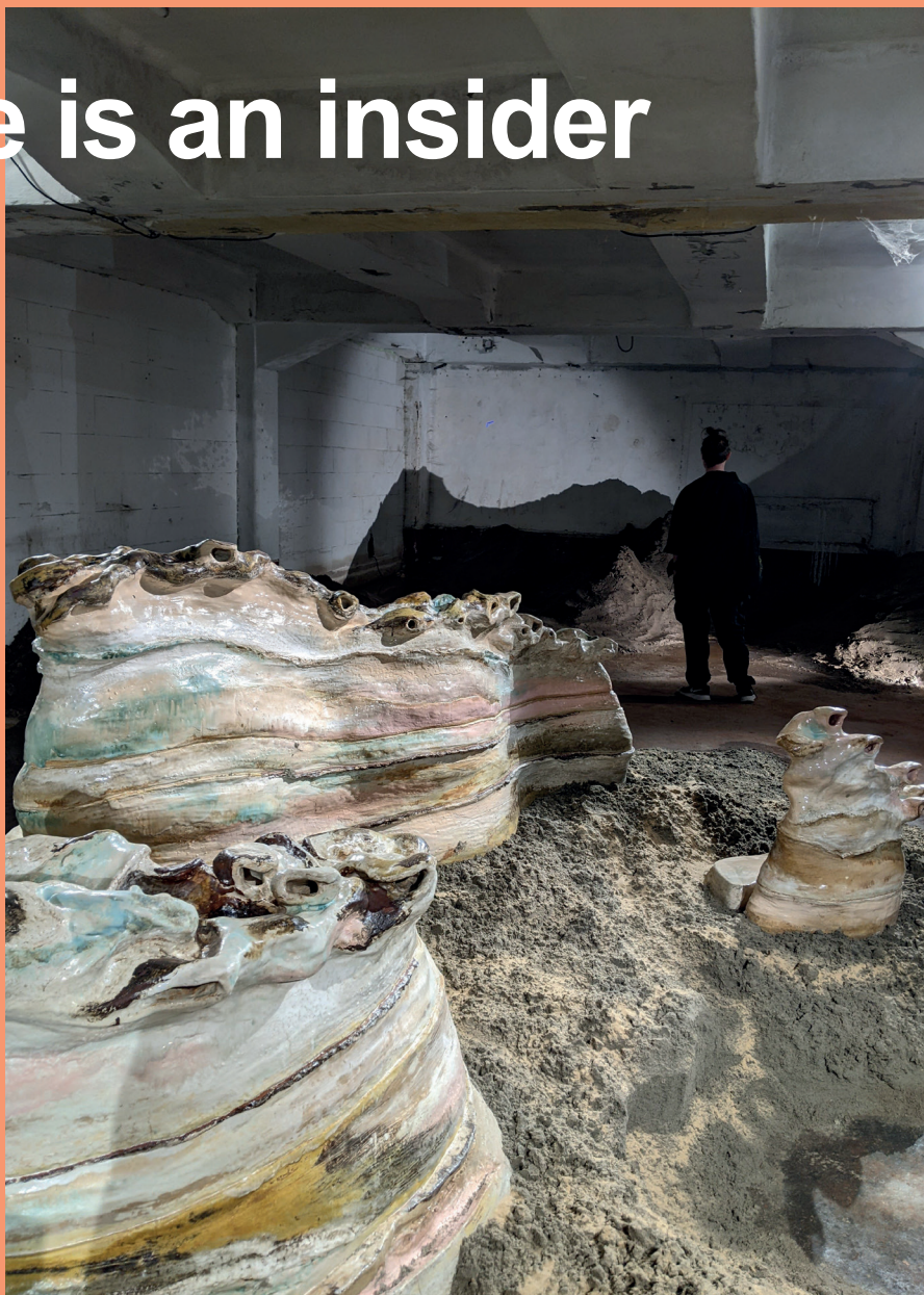
Through Bone and Marrow, 2023 Mirt van Laarhoven