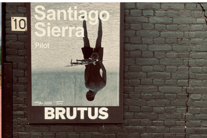
Postercampagne Santiago Sierra