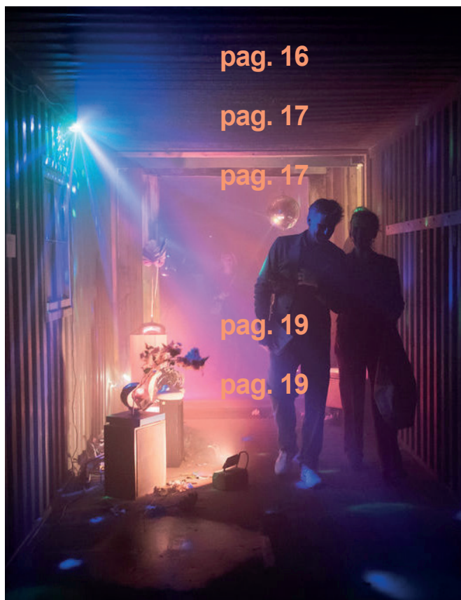
Opening Petromelancholia, 2023 Rachel Youn