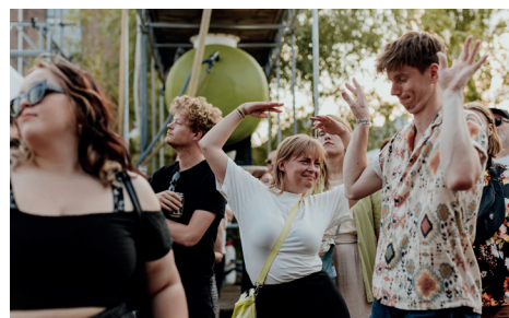
MOMO Fabrique, 2023 at Brutus