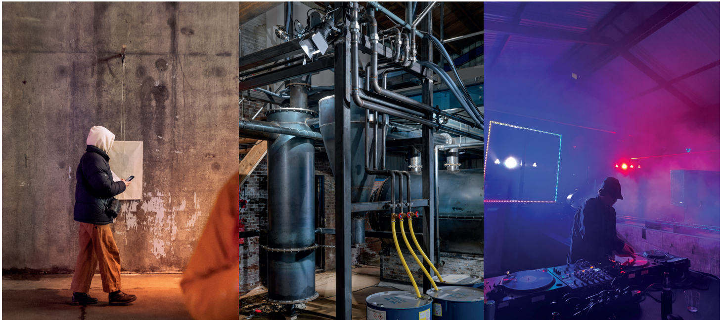
Visitor at Brutus