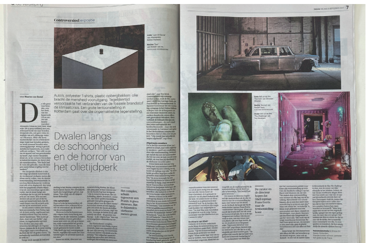
Petromelancholia, artikel in Trouw