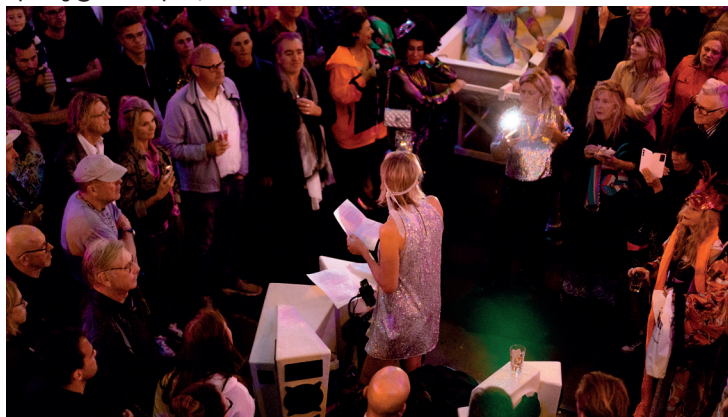
Opening @ Brutus Space, 2023