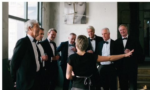
Educatie @ Brutus Space