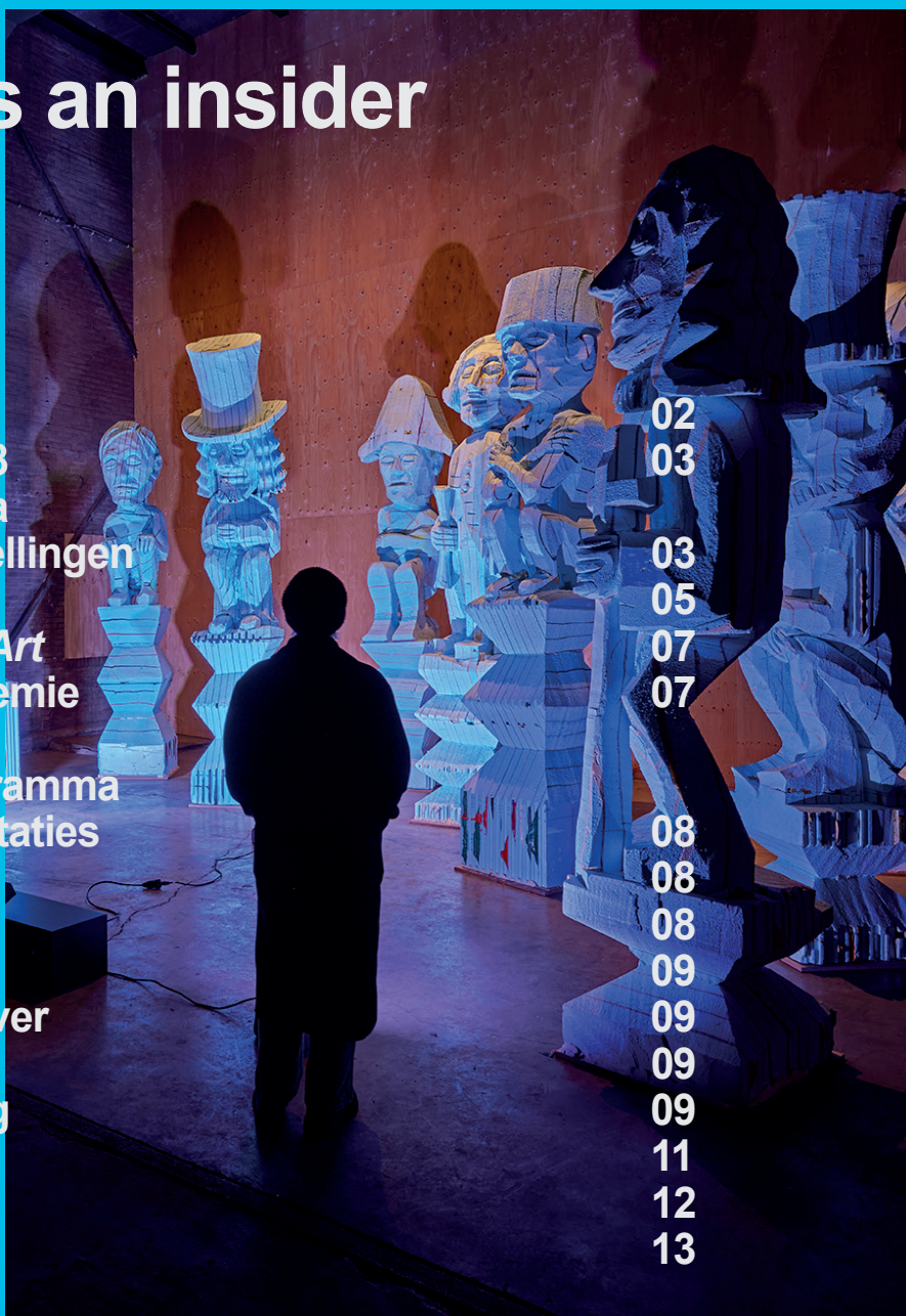
Solotentoonstelling Folkert de Jong, 2024