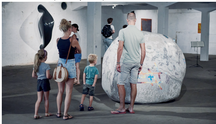
Rotterdamse families op bezoek bij Brutus Space