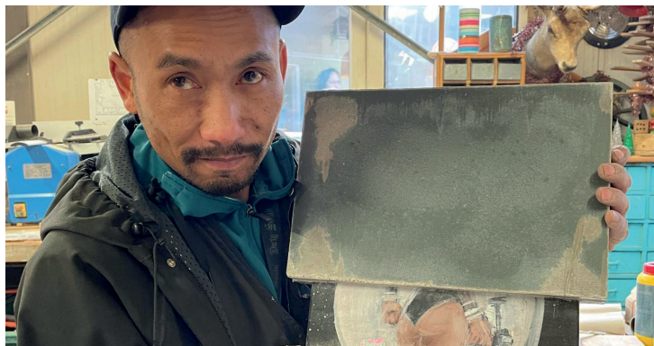
Deelnemer Levenslust Academie